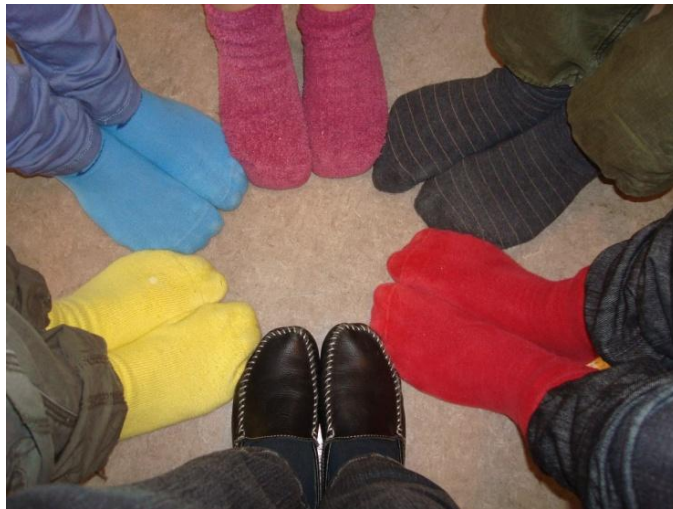
Allir eru einstakir

Einkunnarorð okkar eru: „Allir eru einstakir“ og „Lítill skóli með stórt hjarta“.