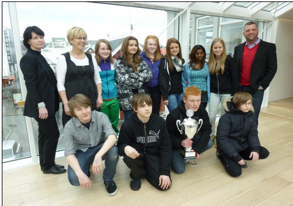
Níundi bekkur sigraði í keppni 9. bekkinga í Raunveruleikum 2011